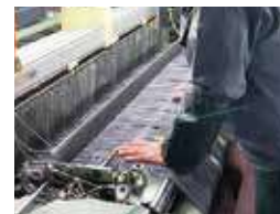
経糸のさばきを確認、往ったり来たりと忙しい。