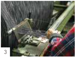
1リビートずつ ドラムに巻く。