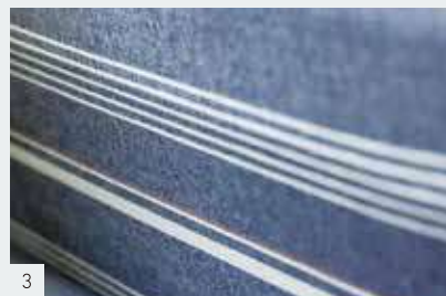
3 横縞の亀田縞41-Bが織り上がった。