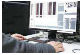
どんな色のどんな縞模様にするか決 め、色ごとに糸の数量を計算する。