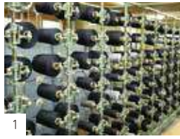
設計書どおりに 色を順番にセット。