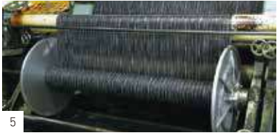
織機にのせるため糸をビームにきつく巻き直す。