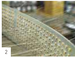
目板に一本ずつ通す (糸の道)。