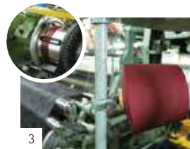
3 緯糸は無地あずき色をセット。