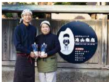
明治38年創業から一世紀以上の歴史ある店。ご主人は五ツ星お米マイスターの資格も持つ。

伝統の技から生まれた新たな製品が地域の記憶をつないでゆく。その原動力は、ご夫婦の地元を愛する想いにある。