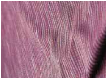
紺色ベースの経糸とあずき色の緯糸でNK17-4が織りあがりました!!