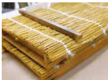
糘作りの要となる「こも」。現代は作る人がいないため毎年スタッフが使用分を手作りする。