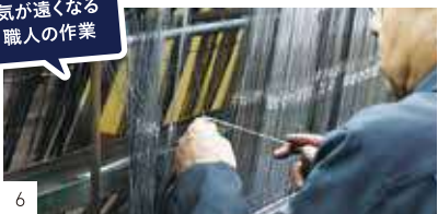
気が遠くなる 職人の作業