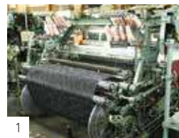
1 織機にビームをセット。