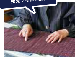
少し織ったら経糸の配置が正しいか点検。