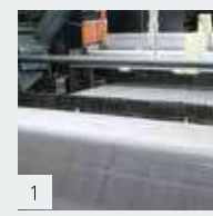
1 この日の経糸は生成色。

全体工程は同じだが、横縞の立川織物では経糸と緯糸の役割が逆になり複数の緯糸が複雑に走る。横縞は緯糸を換えれば多品種小ロット短サイクルで柄を切り替えられるメリットがある。