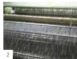
2 経糸は紺に白とカーキのかすり柄。