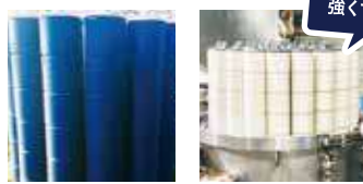
生糸を買いインディゴに染める。亀田 縞は糸を先に染める。染まった経糸 は強度をつけるため糊づけする。