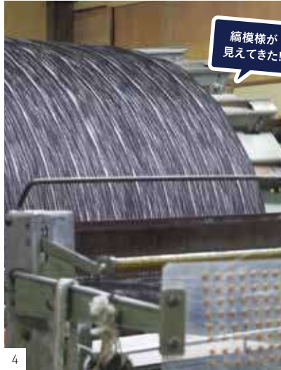
縞模様が見えてきた!